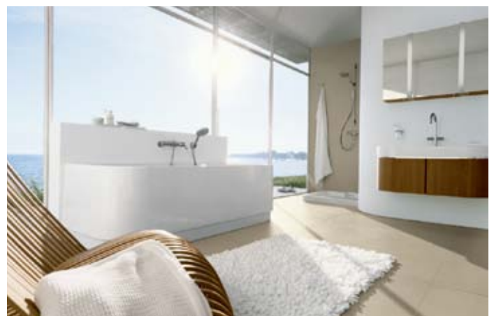
Axor Uno 2