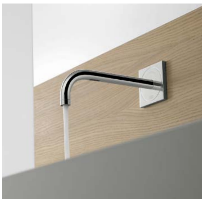
Versión electrónica de la grifería empotrada Axor Uno 2 de diseño minimalista.